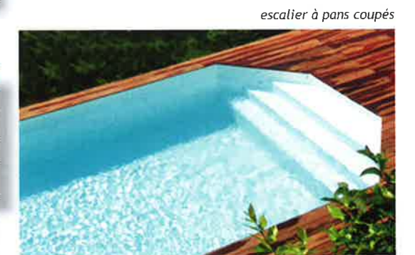
escalier à pans coupés