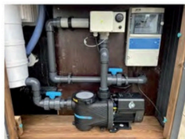
Filtration discrète intégrée